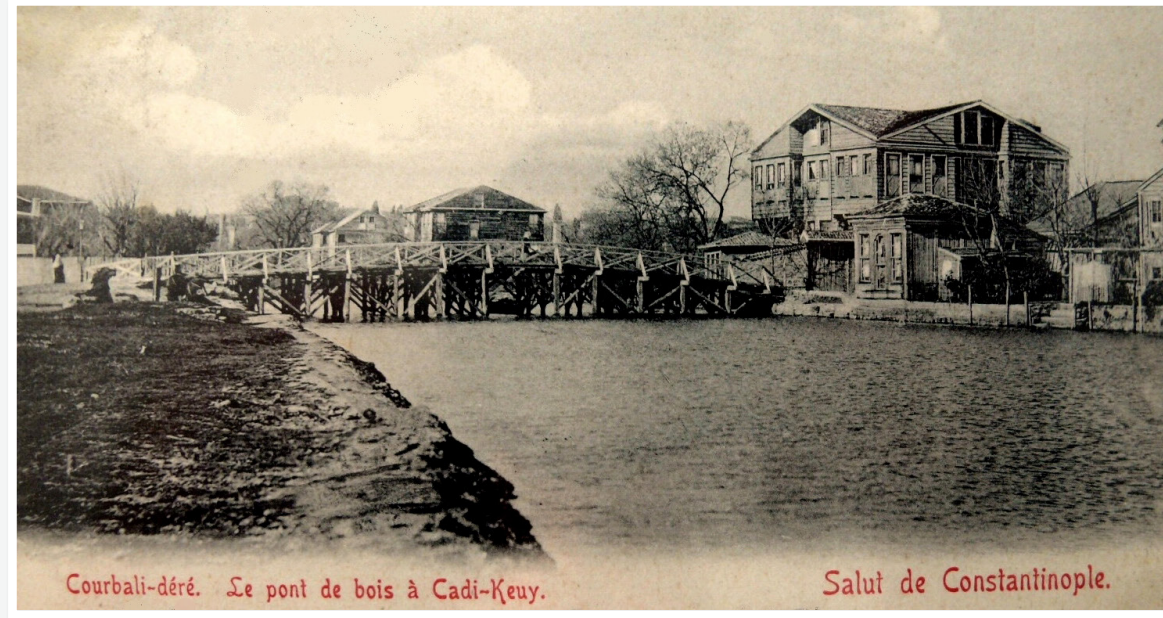
Courbali-déré. Le pont de bois à Cadi-Keuy.