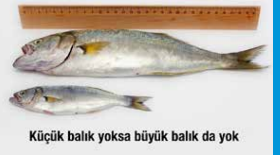
Küçük balık yoksa büyük balık da yok

Siteye buradan ulaşabilirsiniz: www.balikkrehberi.org